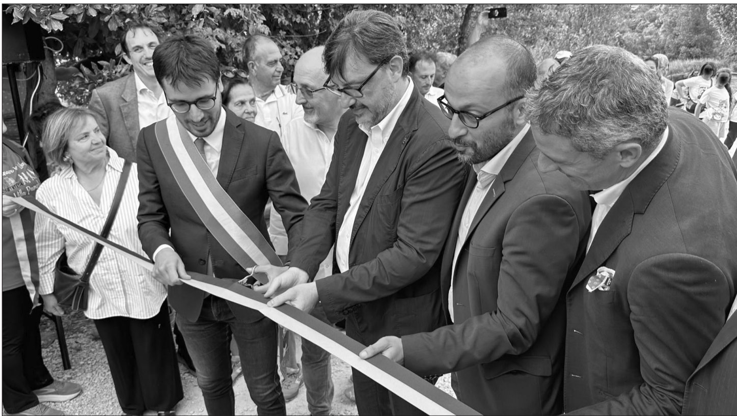
Foto: momenti dell'evento che si è svolto il 15 giugno