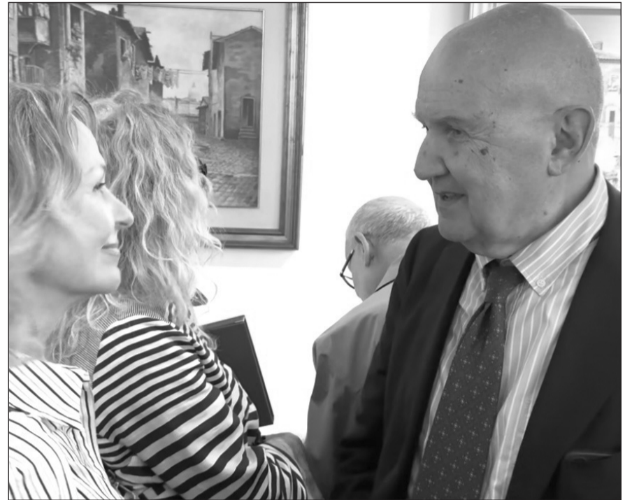
Un momento della cerimonia di inaugurazione