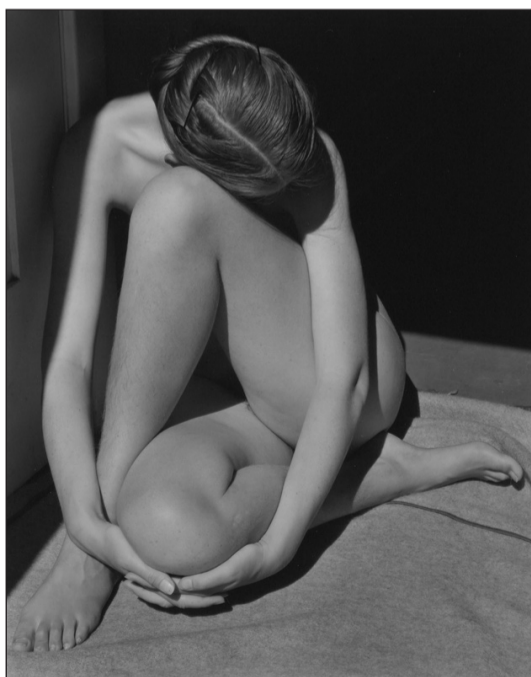
«Nudo 1936» opera dell'artista Edward Weston